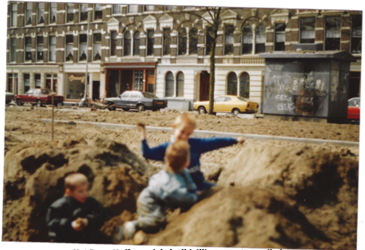
Het Burg. Hoffmanplein is tijdelijk een grote zandbak.